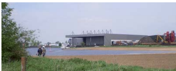
Naturstrand nach Abschluss der Bauarbeiten