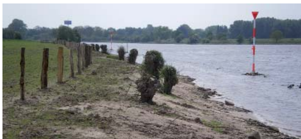
Bereich der vorgelagerte Halbinsel nach Abschluss der Bauarbeiten