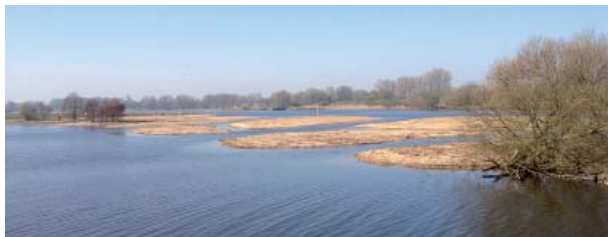
Bereich zwischen Weser und Hemelinger See nach Abschluss der Bauarbeiten

Die Maßnahme wurde im Februar und März 2012 umgesetzt. Die Kosten wurden zur Hälfte aus dem europäischen Fonds EFRE und zur Hälfte aus der Abwasserabgabe finanziert.