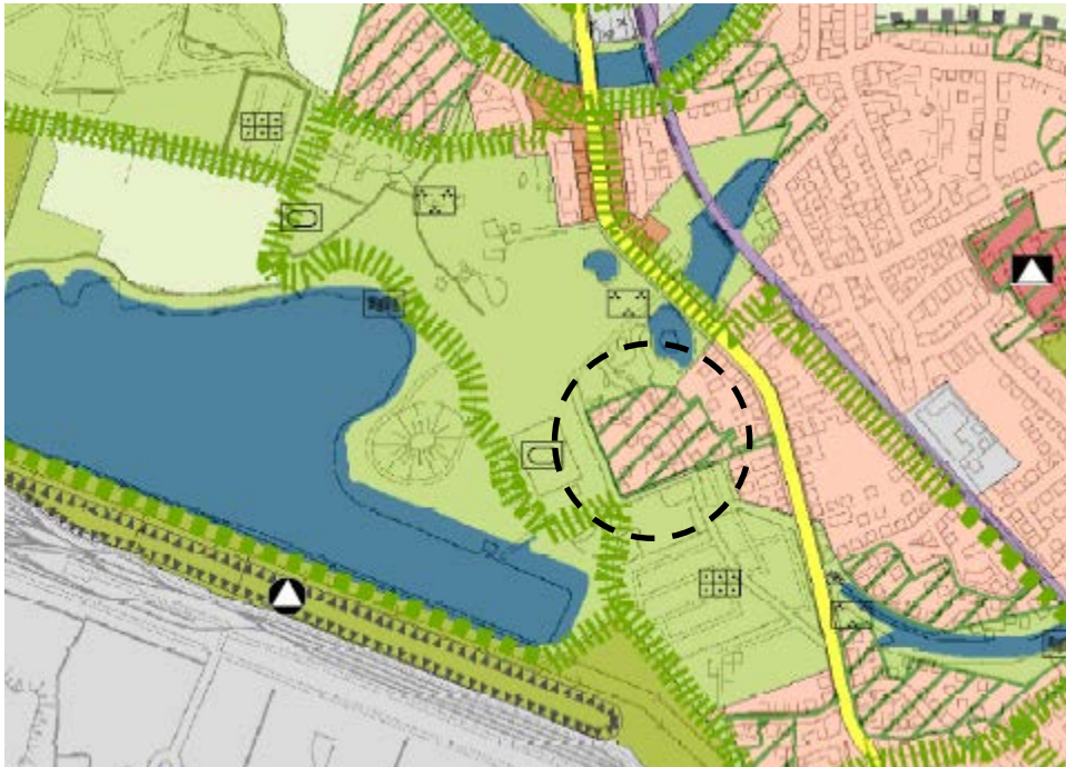
Auszug aus dem Flächennutzungsplan der Stadt Bremen

Weiterhin ist das Plangebiet im Flächennutzungsplan mit einer Grünschräffur überzogen, die Bauflächen mit zu sichernden Grünfunktionen bzw. besonderem Planungserfordernis bei Innenentwicklungsvorhaben darstellt.